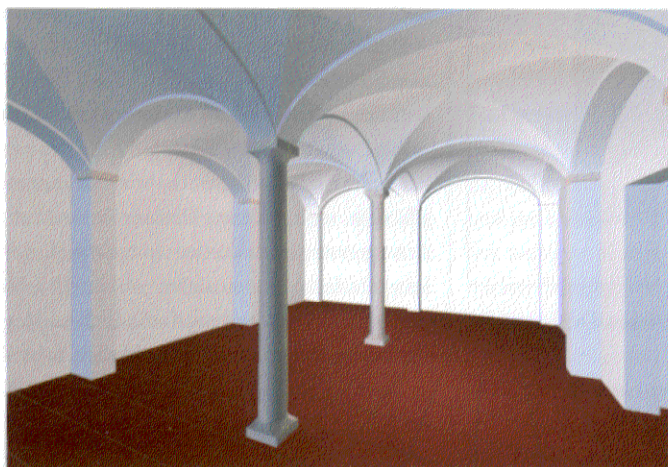
Projekt Weinkeller, Zweisäulenraum, diArco-Modell Bologna, mit Säulenmodell Wasserburg