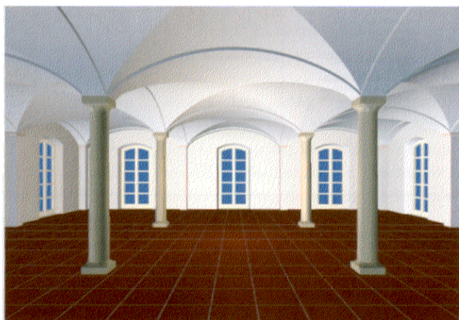
Planungsbeispiel Viersäulenraum, mit dem diArco-Modell Siena, mit Säulenmodell Wasserburg

den Gewölbebau einfacher und darüber hinaus auch preiswert machen. Ebenso modern ist ein elektronisches Medium, das die Firma ab sofort allen interes-